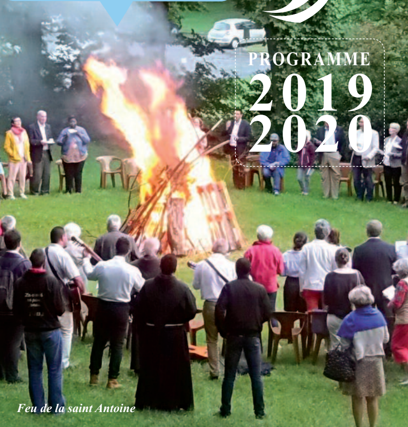
Feu de la saint Antoine